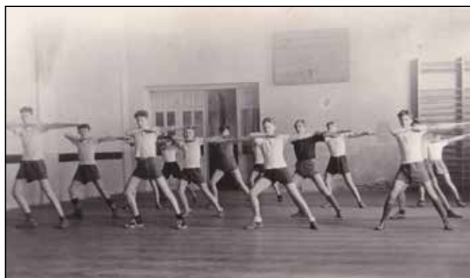
Pekařští učni - nácvik na spartakiádu 1955

1957: Tělocvična je ve velmi zchátralém stavu. Byl požádán odbor TV ONV Zábřeh, aby poskytl potřebný obnos na adaptaci tělocvičny.“