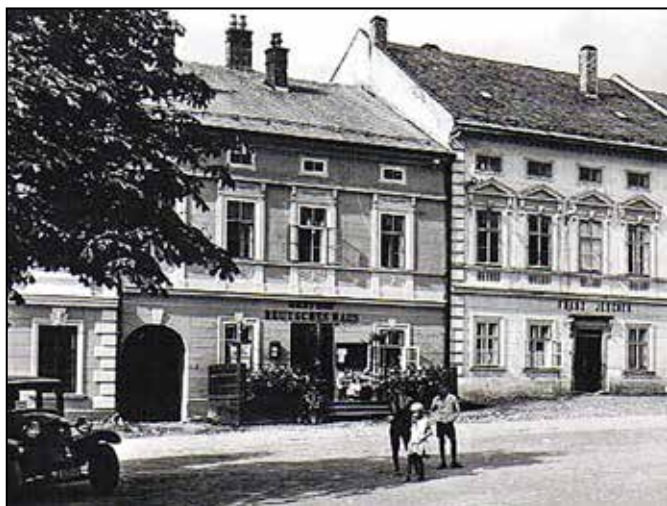
Dům č. 5 kolem roku 1930

hostinec, potom jako sál k zábavám i jako tělocvičná místnost (zvláštní tělocvična pod sálem k zahradě v přízemí), není zatím zájem. Říká se mu Společenský dům a má sloužit všem spolkům a korporacím.“ 5