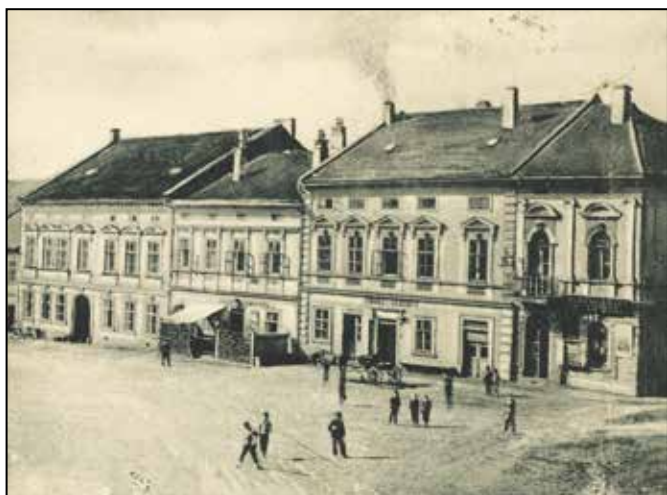
Hotel Schwestka - výřez z pohlednice odeslané r. 1899

V roce 1869 je jako majitel uváděn Johann Schwestka, hostinský, nar. r. 1839, v domě tehdy žilo 6 lidí a u stavení byly 3 kusy hovězího dobytka. Johann Schwestka je uváděn v dokumentech i v letech 1880, dále v roce 1889, kdy dům opět vyhořel, roku 1890 (v této době se počet obyvatel domu rozrostl na 9, přibyl i dobytek – 2 koně, 5 krav) a roku 1900. Schwestka provozuje hostinskou činnost ještě na počátku 20. století, jak je patrné z nejstarších pohlednic a fotografií náměstí, na kterých je vidět štít nad vchodem – HOTEL SCHWESTKA. K podnikání slouží patrně přízemí s malou přístavbou, v létě bývá před domem pro hosty zahrádka s venkovním posezením.