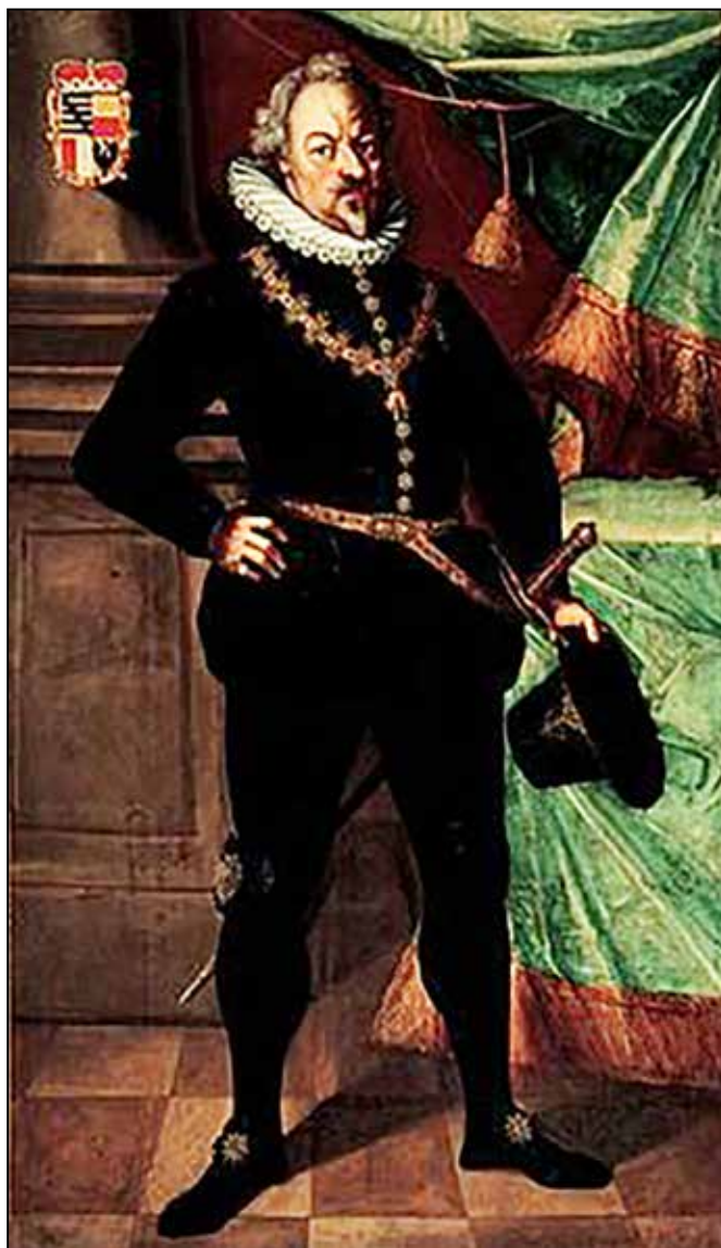
Karel I. von Liechtenštejn

První z Liechtenštejnů, který šilperské panství získal, se jmenoval Karel I. z Lichtenštejna (1569 – 1627). Karel byl zakladatelem knížecího rodu Liechtenštejnů. Byl to schopný politik a chytrý hospodář i diplomat. Za panování císaře Rudolfa II. zastával funkci hofmistra, což byl nejdůležitější úřad u dvora. Položil základy velkého rodového bohatství, které získával různými způsoby: zdědil je, vyženil, koupil či je získal při konfiskacích. Nejen šilperské panství, ale stejně tak Zábřeh, Šumperk, Lanškroun, Velké Losiny nebo Rudu nad Moravou. Pohřben je v rodinné hrobce ve Vranově. Jeho syn