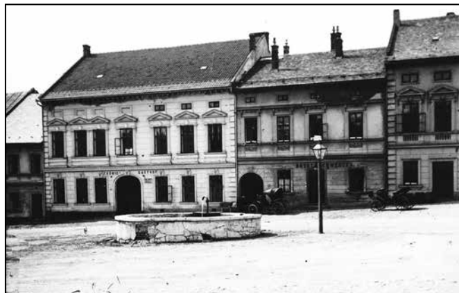
Chátrající Hotel Schwestka, rok 1910