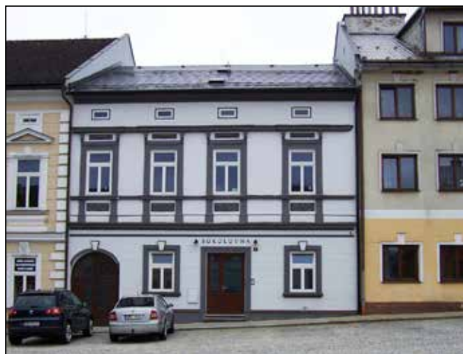
Dům č. 5 v současnosti.