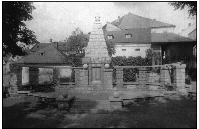
Památník se jmény padlých

sem hlíny a suti v hadrech zabalená poničená deska se jmény padlých. Patrně tehdy někdo desku zachránil a tajně ukryl pro generace příští... Replika desky se dnes nachází v chodbě márnice při vstupu na hřbitov.