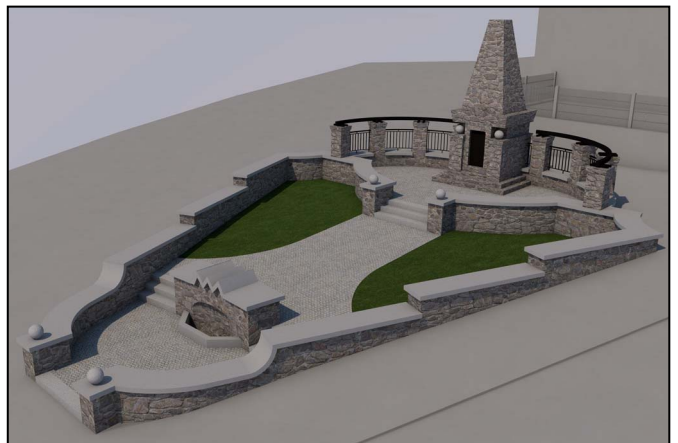
Takhle by měl pomník vypadat po rekonstrukci

V roce 1965 byla nově vydlážděna ulice z náměstí kolem staré radnice k pomníku, práce byly dokončeny k 9. květnu - k 20. výročí osvobození. Průvod občanů se ubíral k památ-