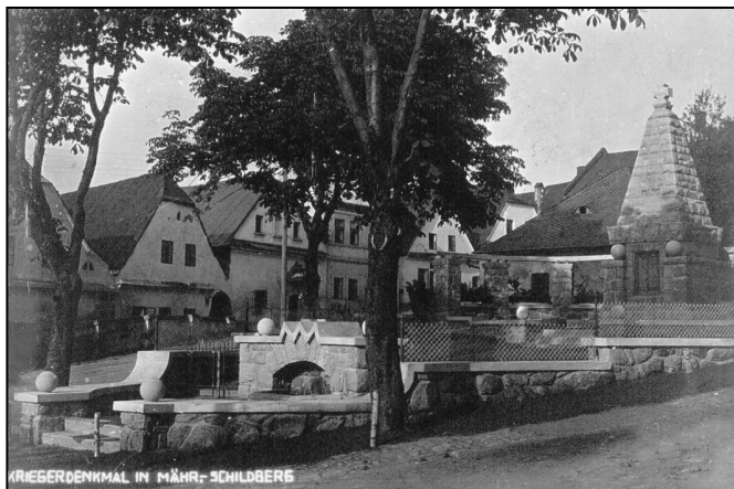
Celý pietní areál na pohlednici z roku 1926

Jak je patrné z pohlednice, šlo o celý pietní areál, mohyla stála o hodně výš než pozdější památník osvobození. Na přední straně mohyly se nacházela deska se jmény padlých. Nešlo však jen o Němce - byla tam i jména česká, za Rakouska-Uherska museli jít za císaře pána do války všichni, ať byli jakékoliv národnosti. Pramen z bývalé kašny byl podchycen a vyveden do malé kašničky ve spodní části areálu 2 . Osud pomníku se naplnil v padesátých letech, kdy byla mohyla odstraněna (kroniky zde mlčí a nedá se dohledat přesné datum ani okolnosti). Když se roku 2013 opravovala štítecká radnice, byla při úklidu na půdě nalezena pod 20 cm náno-