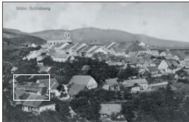
Pohlednice Šilperka z přelomu století s budovou barvírny a bělírny vlevo dole