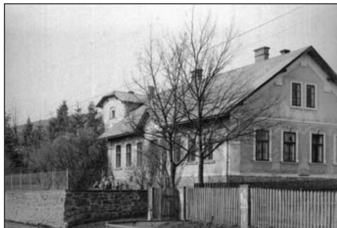
Kindergarten v 30. letech 20. století