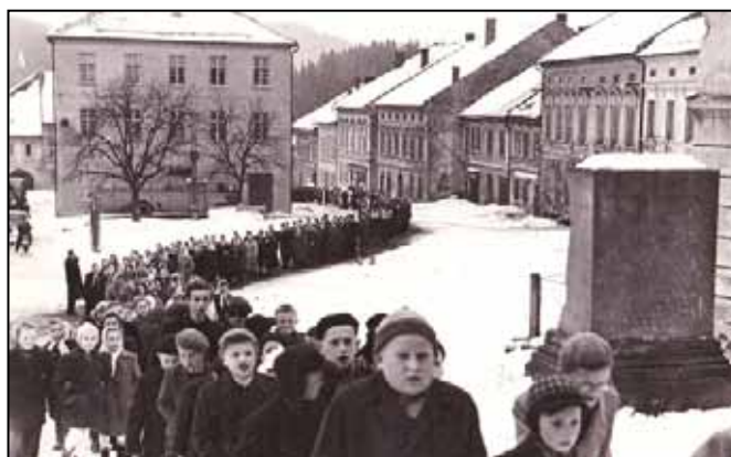
Torzo kříže - rok 1955.