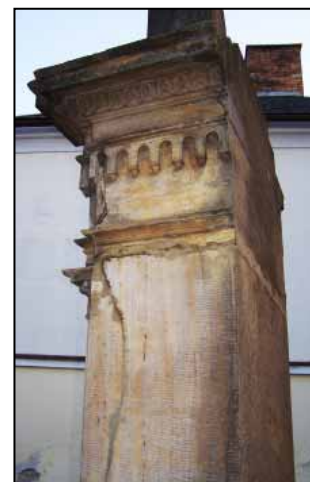
Jizva po zlomenině je patrná i dnes, po více jak šedesáti letech.