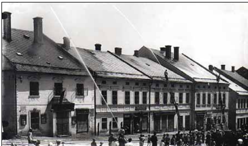
Cvičení hasičů na šilperském náměstí v třicátých letech min. století

Dne 25. 5. 1995 byla uzavřena smlouva mezi MěÚ Štítý, referátem obrany a ochrany OkÚ Šumperk a SDH Štítý o součinnosti a spolupráci při krizových situacích na území města Štítý při realizaci Krizového plánu OkÚ na území okresu Šumperk v rámci opatření civilní ochrany a hospodářské mobilizace. Následně bylo nahrazeno cisternové vozidlo ŠKODA RT-706