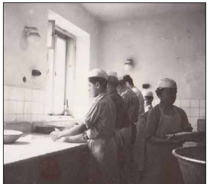
Pekařští učni, 1955