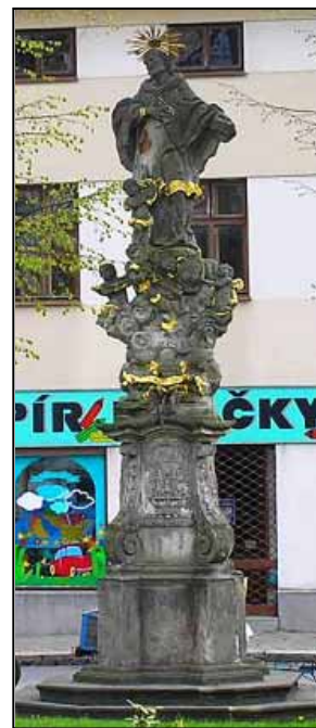
Socha sv. Jana Nepomuckého v 90. letech min. století

Během let 1910 a 1970 probíhala rozsáhlá rekonstrukce. Obrazy v kostele převážně vyobrazují život a smrt Jana Křtitele. Po levé straně od oltáře stojí soška Panny Marie. Součástí kostela jsou také varhany s ojedinělou květinnou výzdobou omítek z roku 1910. V roce 2009 byl kostel zapsán do seznamu nemovitých kulturních památek.