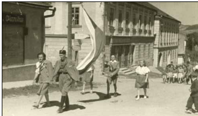
Průvod Sokolů k sokolskému hřišti r. 1947 při příležitosti obnovení spolupráce s ochrankou Sokol Brno Královo Pole

Sokolu ve Štítech (tehdy v Šilperku) předcházela tělovýchovný spolek OREL, který po pěti letech fungování ukončil svou činnost v r. 1926. Zakládací schůzka proběhla dne 19. 10. 1930 v Národním domě v Šilperku (dnes CBA) za přítomnosti sta-