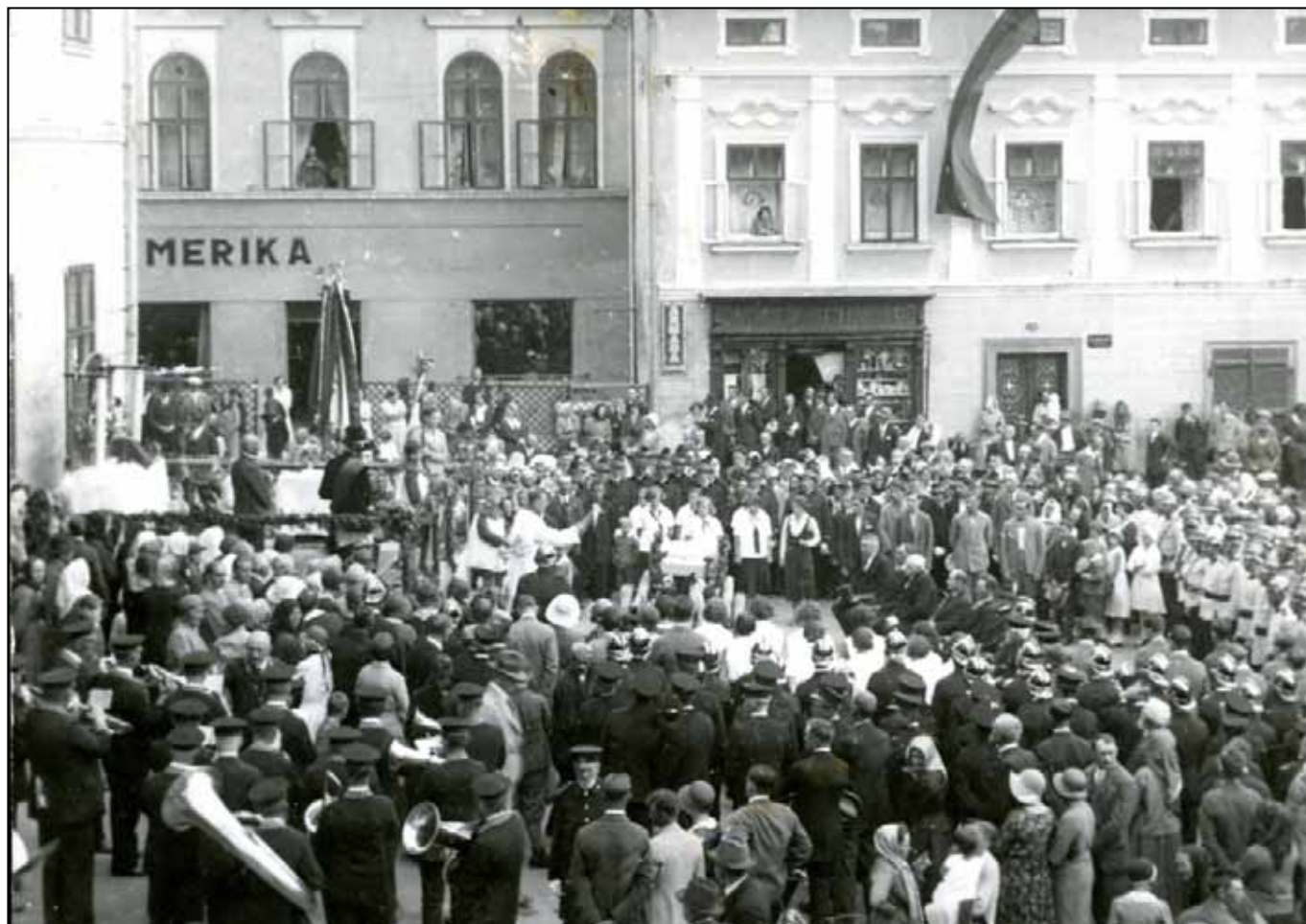
Shromáždění občanů před radnicí v třicátých letech min. století