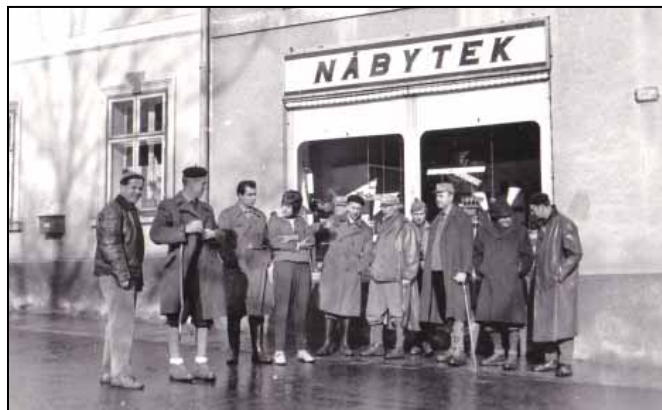
Zahájení 100 jar. km - rok 1965