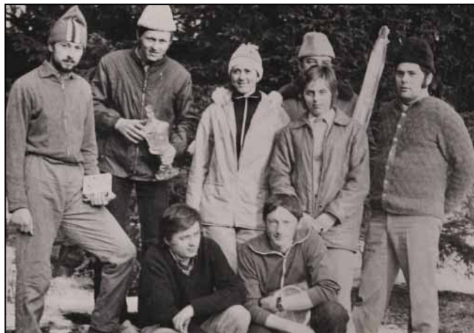
Štítecká lyžařská elita

Kromě závodění připravovali členové oddílu lyžařské stopy v okolí Štítů a pořádali závody, například okresní přebory, Jesenické můstky, štafety Divize Morava, přebory župy... Spolu se školou bývaly pravidelně pořádány školní lyžařské závody i okresní lyžařsko-branný závod. Tehdy tak úspěšný oddíl, který byl několik let zařazen v II. lize oblasti Morava, je dnes v naprosté nečinnosti.