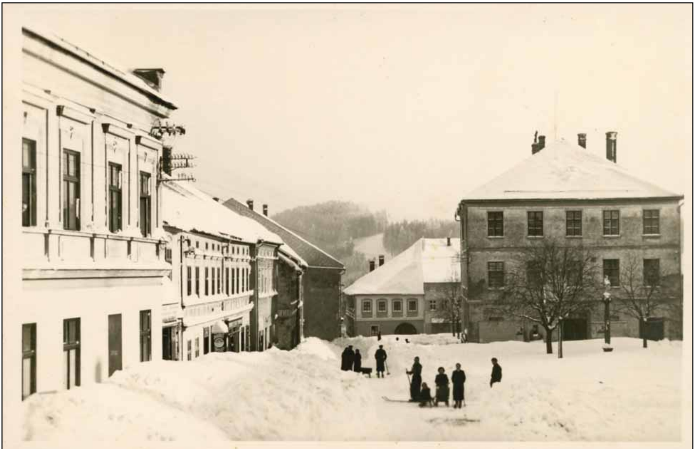
Pohled na šilperské náměstí v období protektorátu