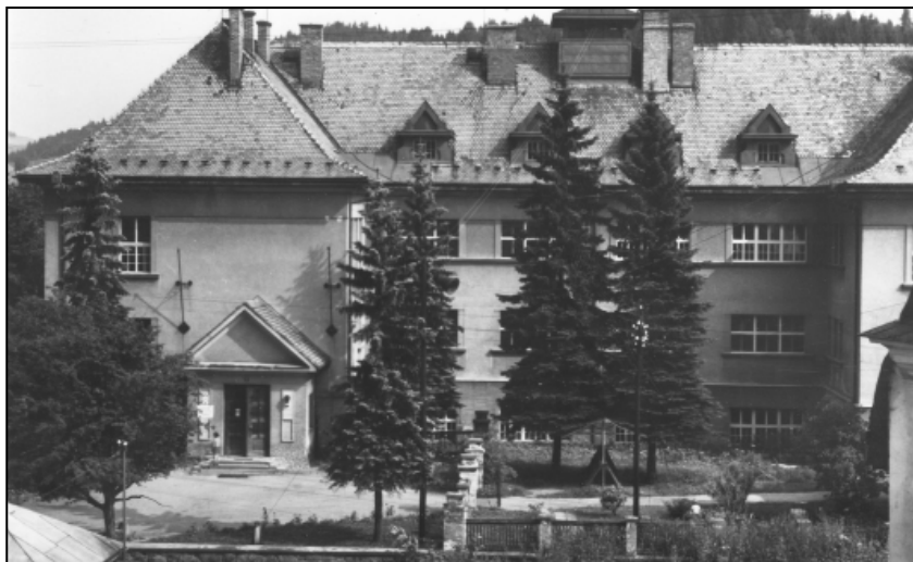
Takto vypadala budova školy před padesáti lety

u nádraží, která byla zakoupena od Němce H. Bartosche. Za I. světové války české školství upadalo, ale po jejím skončení se vše obrátilo k lepšímu. V roce 1919 se začala pro školní účely užívat i budova německé opatrovny (dnešní MŠ) a 1. patro hostince „U koruny“ (CBA). V r. 1920 byla otevřena česká zimní hospodářská, později zemská odborná škola hospodářská, a od roku 1922 byla zřízena kromě obecné školy i škola měšťanská. Tato již spádová škola čítala až 350 žáků a vyučování v provizorních prostorách přestalo vyhovovat. Dne 10. 8. 1924 byl položen základní kámen a 20. 6. 1926 proběhlo slavnostní otevření nové školní budovy. Zde fungovala mateřská, obecná i měšťanská škola a to od r. 1930 pod názvem „Masarykova škola“. Během II. světové války byla česká škola zavřena, děti se do ní mohly vrátit opět až v roce 1945.