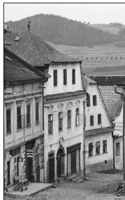
Církevní slavnost na konci 19. století