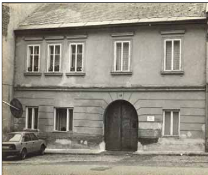
V tomto domě č. 9 na náměstí (foto z devadesátých let) se nacházela první česká škola