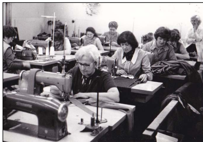
Pohled do dílny „šití“. Vzpomínkové foto z let 1975-1980