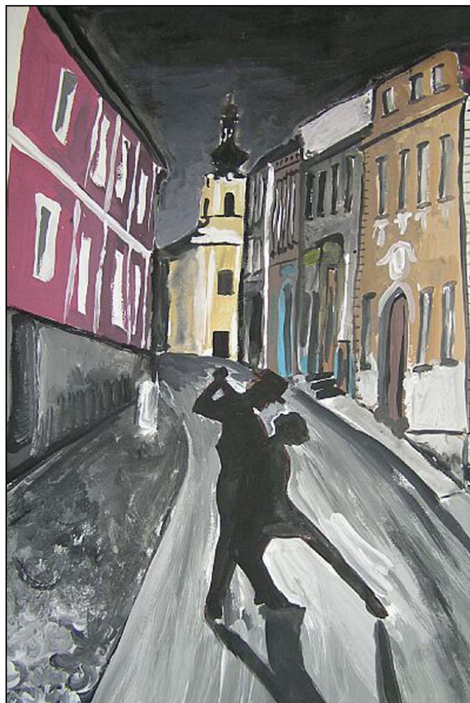
Z archivu redakce prací ZŠ Štítý