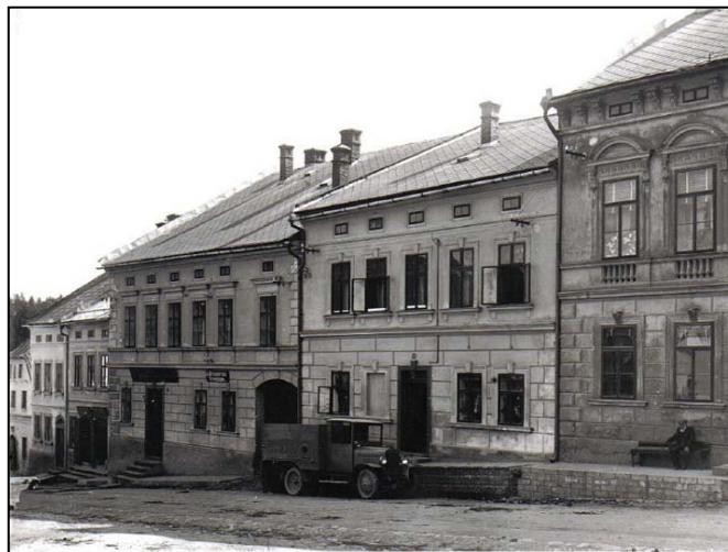
Dům č. 12 (uprostřed) na fotografii z 30 tých let minulého století

V období 1. republiky je historie tohoto domu spojena s provozem kartáčovny a se jménem obchodníka Adolfa Schmieda 4 . Po smrti měšťana Beckera koupil tento podnikatel dům č. 12 a přestěhoval sem provoz kartáčovny, která se do této doby nacházela v zadním traktu domu č. 42 5 , a dál podnikal pod firmou Schmidt & comp. Schildberg 6 . Provozovna vyráběla veškeré kartáčnické a štětkařské zboží a velmi dobře prosperovala i po dobu okupace.