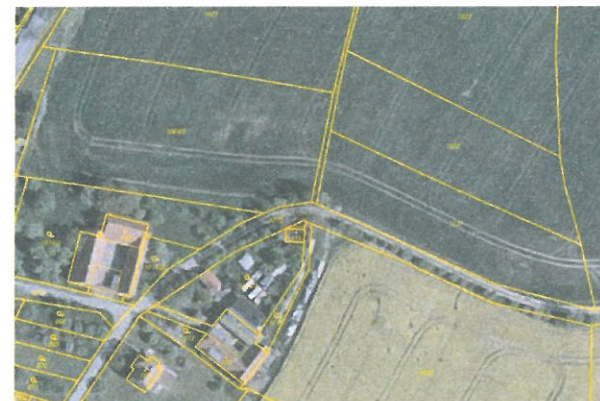
Ortofoto s obrazem katastrální mapy po obnově katastrálního operátu

Po skončení prací na obnově katastrálního operátu dochází k vyhlášení jeho platnosti. Podle § 62 odst. 2 katastrální vyhlášky (č. 26/2007 Sb.), zašle katastrální úřad sdělení o vyhlášení platnosti obnoveného katastrálního operátu obci, na jejímž území byl katastrální operát obnoven. Vyhlášení platnosti zveřejní katastrální úřad v součinnosti s obcí podle § 62 odst. 3 katastrální vyhlášky. Katastrální úřad a Český úřad zeměměřický a katastrální zveřejní vyhlášení platnosti obnoveného katastrálního operátu rovněž na svých internetových stránkách.