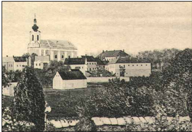
Budova věznice (pohled od hřbitova) kolem r. 1925 na výřezu z pohlednice s kresbou kronikáře Rudolfa Gablera.

Objekt byl postaven jako věznice roku 1867, krátce po vybudování nové radniční budovy (č. 55) uprostřed náměstí. Ta byla postavená roku 1857 pro potřeby okresního soudu, berního úřadu a městské správy (bývalá radnice č. 38, jejíž součástí byla i šatlava, byla přebudována na měšťanský dům již v polovině 18. století).