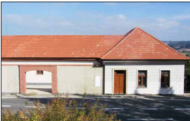
Současný stav – budova bývalé věznice před dokončením.

Roku 2020 začala nová etapa v historii budovy. Město Štítý provádí se svými pracovníky kompletní rekonstrukci celého domu, která by měla být dokončena na podzim roku 2021. Vnitřní uspořádání prostor bývalé věznice se změnilo, ale zvenku je celek zachován v původní podobě. Místní zájmové spolky získají přestavbou dvě klubovny pro svou činnost. Prostory celého východního křídla (směrem k náměstí) jsou přebudovány na „spolkovnu“ s příslušenstvím (= malé zařízení pro pořádání drobnějších společenských akcí občanů – srazy, oslavy, rozloučení, schůzky atd). Účastníci těchto akcí budou mít v letních měsících k dispozici i upravené venkovní prostranství s posezením v atriu. Zahrádkáři budou využívat jako moštárnu prostory v suterénu směrem k náměstí, vyklizené sklepní prostory mají sloužit městu jako sklad materiálu.