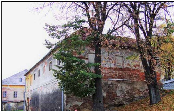
Stav před rekonstrukcí.

Roku 2020 začala nová etapa v historii budovy. Město Štítý provádí se svými pracovníky kompletní rekonstrukci celého domu, která by měla být dokončena na podzim roku 2021. Vnitřní uspořádání prostor bývalé věznice se změnilo, ale zvenku je celek zachován v původní podobě. Místní zájmové spolky získají přestavbou dvě klubovny pro svou činnost. Prostory celého východního křídla (směrem k náměstí) jsou přebudovány na „spolkovnu“ s příslušenstvím (= malé zařízení pro pořádání drobnějších společenských akcí občanů – srazy, oslavy, rozloučení, schůzky atd). Účastníci těchto akcí budou mít v letních měsících k dispozici i upravené venkovní prostranství s posezením v atriu. Zahrádkáři budou využívat jako moštárnu prostory v suterénu směrem k náměstí, vyklizené sklepní prostory mají sloužit městu jako sklad materiálu.