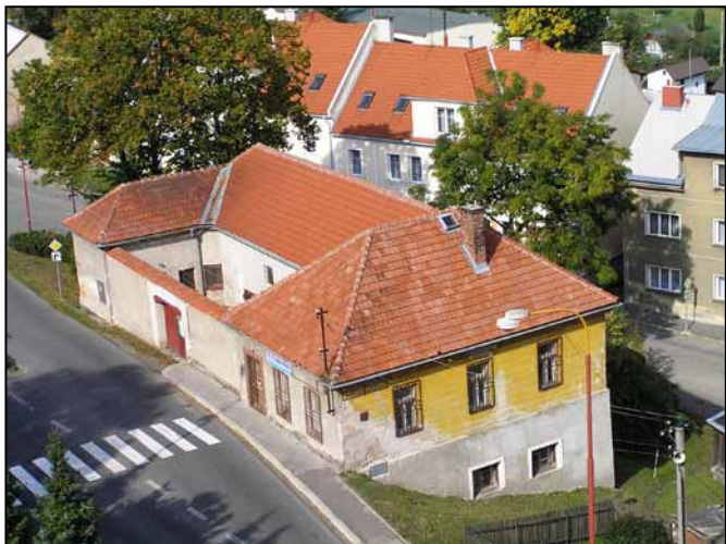
Objekt bývalé věznice z kostelní věže r. 2012.

Roku 1994 zřizuje Svaz zahrádkářů Štítý „na věznici“ moštárnu. V dokumentaci svazu se nachází potvrzená „Smlouva o pronájmu prostorů na č. 336 z 1. 1. 1994 – moštárna v kůlně ve dvoře“ (prostory v západním křídle). Nad vraty je umístěn vývěsní štít s nápisem MOŠTÁRNA (zajímavost: text na druhé straně cedule připomíná činnost svazáků: ZDE PRAČUJE KOLEKTIV SOUTĚŽÍCÍ O TITUL BSP). 6