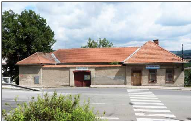
Průčelí budovy (od zdr. střediska) roku 2012.

lanterii a zahrádkářskými potřebami, poté je zde krátce prodejna náhradních dílů k automobilům.