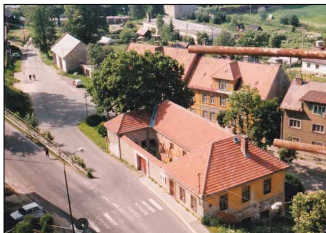
Objekt bývalé věznice roku 1997. Pohled z věže kostela.

Po sametové revoluci dochází s rozvojem soukromého podnikání k opětovnému využití východního křídla budovy. V letech 1991–1993 provozuje fa F & F obchod s textilem, ga-