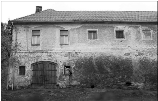
Pohled na budovu z ul. Nákladní, podzim 2018.

Kolem roku 1995 jsou místnosti ve východním křídle upraveny a veterinární lékař zde otvírá veterinární ambulanci. Roku 2005 přebírá ordinaci zvěrolékař MVDr. Jiří Koltů a provozuje zde veterinární praxi až do roku 2019, kdy přeseďluje do vlastních prostor.