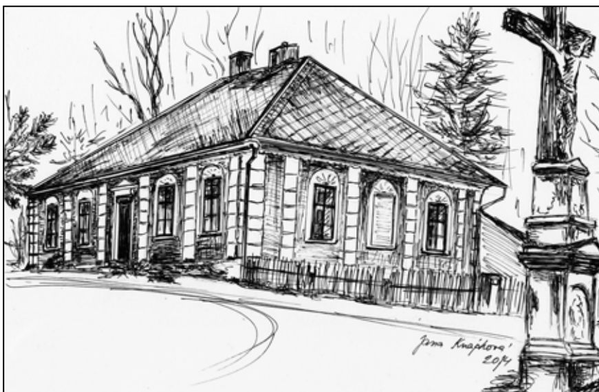
Heroltice - kříž před kostelem s bývalou farou.

V posledních letech se ukazuje, jak moc je důležité mít ve vlastnictví vodu, ČOV, byty, lesy, budovy, pozemky, prostě vlastnit majetek. Máme s tím hodně starostí, ale rozhodujeme si o našem majetku sami a zisk, který z toho plyne, používáme na rozvoj našeho města. V letošním roce jsme v březnu schválili harmonogram stavebních akcí na letošní rok. Na dané investice i opravy jsme si v posledních letech vytvořili finanční rezervu. Jenže jsme nepočítali s tím, že se nám vláda ČR svým nezodpovědným rozhodnutím bude snažit vzít několik milionů. Kdo mě sleduje na facebooku ví, že často kritizují kroky vlády, které poškozují města a obce. Současně rozhodnutí zadlužit letos naši zemi částkou 500 miliard je dle mého soudu velmi špatné a následky poneseme několik dalších let. I přes tuto složitou dobu pokračujeme ve Štítech v hlavních investicích a opravách, do kterých