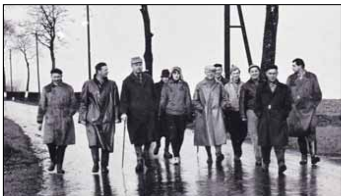
Výcházka za každého počasí.

i vyššími státními a rezortními vyznamenáními. Přes všechnu tu pestrou práci a dílo zůstal člověkem obyčejně lidským, skromným a nenáročným, zůstal mu smysl pro spravedlnost, čestnost a humor, nesnášel politikaření a kariérismus. Opustil nás před dvaceti lety, ve stejný den, kdy mu byl o 54 let dříve vystaven jeho nástupní dekret na šilperskou školu.