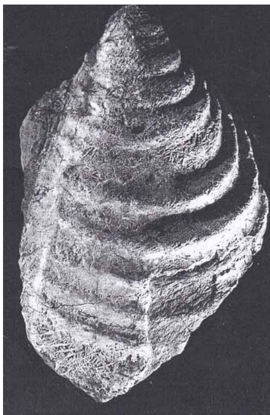
3. Mlž Inoceramus sp., Štíty, skutečná velikost 12 × 8 cm, sbírky VM v Šumperku, foto J. Mašek